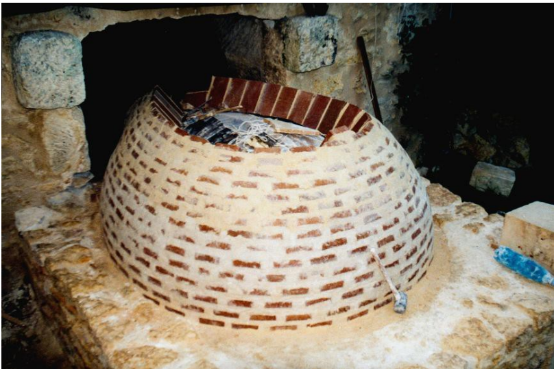
Lage 14. Hinterer Teil