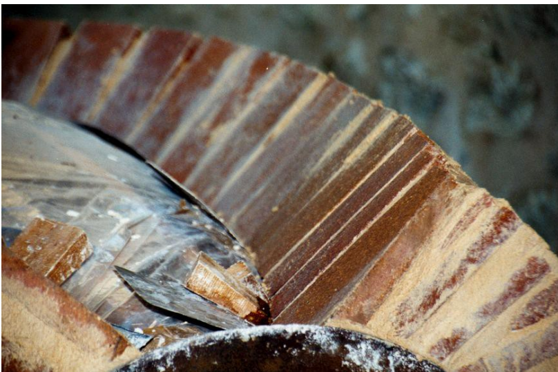
Lage 13. Detail-Aufnahme im vorderen Bereich. Eine große Anpassungsarbeit ist zu leisten. Ziegel sollten nicht zu schmal werden, so daß mitunter drei Ziegel etwas verjüngt werden, wenn zwei ein wenig zu schmal sind.