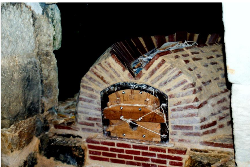
Lage 14. Die Ebenen beginnen sich zu berühren und damit beginnt ein Mehr an Anpassungsarbeit