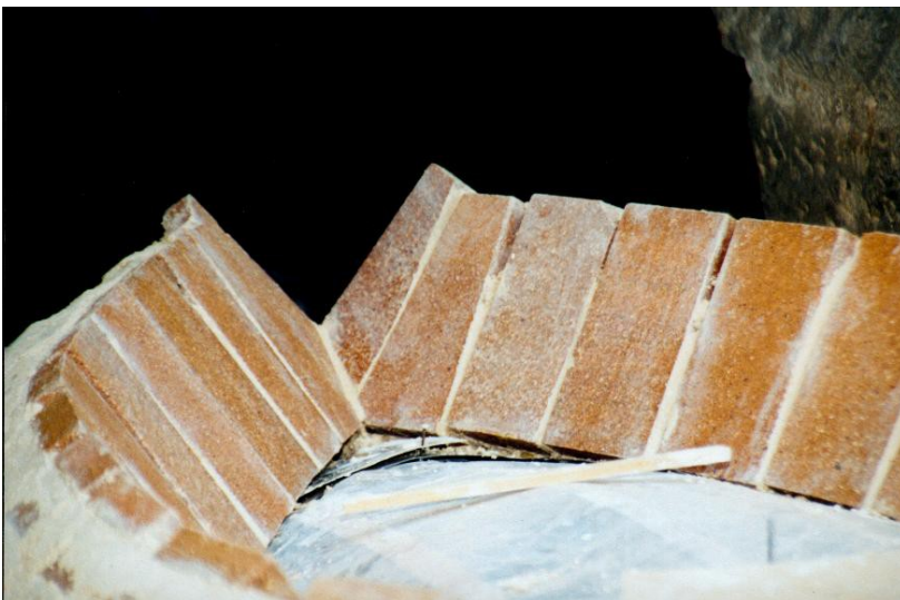
Lage 15. Detail-Foto. Die beiden Hörner werden später abgeschliffen.

Man beobachte, wie z.B. der zweite Ziegel von rechts leicht konisch zugeschnitten wurde, um an dieser Stelle eine keilförmige Mörtelspalte zu erreichen.