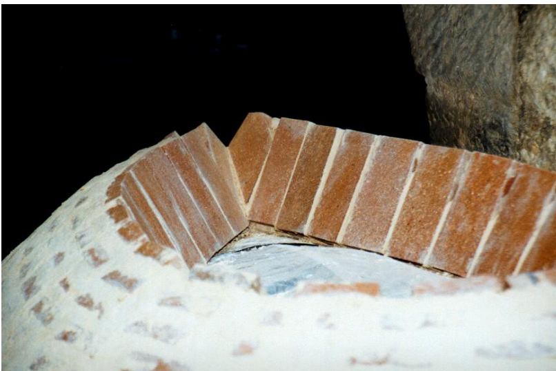
Lage 16. Detail-Foto