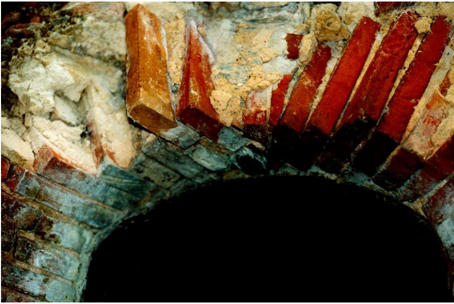
Detail-Fotos von der Ruine außen