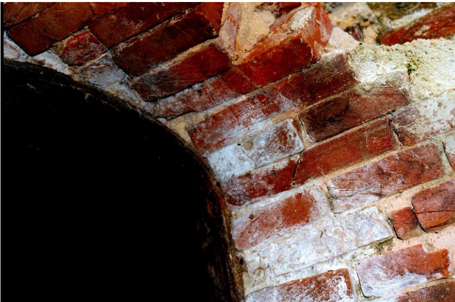
Detail-Fotos von der Ruine außen