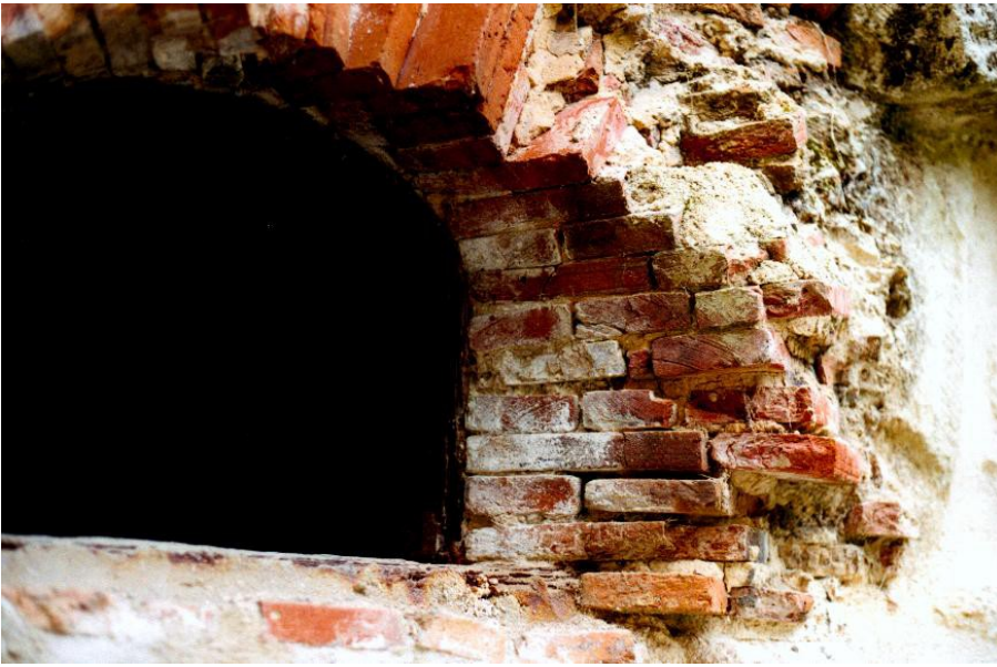
Detail-Fotos von der Ruine außen